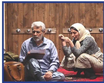
کانون سینما و تئاتر برگزار کرد: