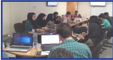
انجمن علمی - دانشجویی الکترونیک برگزار کرد: