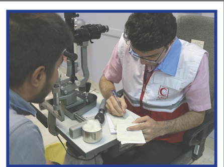
کانون هلال احمر برگزار کرد: