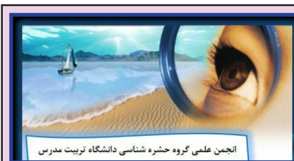
انجمن علمی گروه حشره شناسی دانشگاه تربیت مدرس

کارگاه آموزش مقدماتی و پیشرفته ی نرم افزار MATLAB با حضور جمعی از دانشجویان رشته های فیزیک، شیمی، مکانیک، اقتصاد، نرم افزار و آمار زیستی شهریور ماه ۹۵ در محل دانشکده فیزیک دانشگاه تربیت مدرس برگزار شد. در طول کلاس های مقدماتی، اصول کاربردی این نرم افزار محاسباتی طی ۱۵ ساعت آموزش داده شد. شرکت کنندگان طی این دوره با اصول طراحی برنامه ها و محاسبات با متلب آشنا شدند. دوره ی پیشرفته ی آموزش نرم افزار طی ۲۴ ساعت و در طول ۶ روز ارائه شد. در این دوره شیوه های طراحی برنامه های محاسباتی، اصول محاسبات عددی، شبیه سازی، اصول پردازش تصویر و مطالب پیشرفته تر مرتبط با برنامه نویسی و نرم افزار متلب آموزش داده شد. در پایان هر دو دوره ی آموزش این نرم افزار با حل مثال های متعدد به صورت عملی به رفع اشکال و ابهام های دانشجویان پرداخته شد.