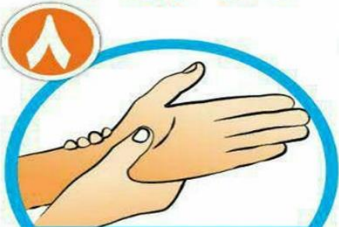
دور میچ هر دو دست را بشویید.